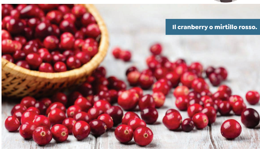
Il cranberry o mirtillo rosso.

Può essere alternato con Mercurius corrosivus , polvere cristallina che fa parte della