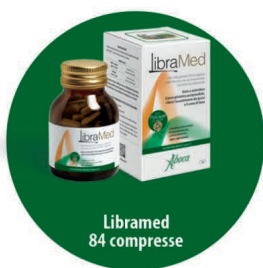
Libramed 84 compresse

Insieme a te per aiutarti nel controllo del peso.